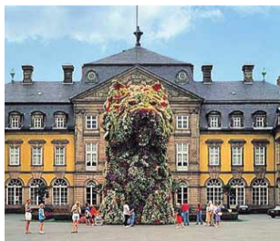
Zwölf Meter groß mit Blumen: Jeff Koons Puppy

Jonathan Borofsky schickte für seinen „Hammering Man“ wenigstens einen Entwurf im Maßstab eins zu drei. Dazu eine Skizze, wie die 22 Meter hohe Aluminiumfigur mit beweglichem Arm später innen aussehen muss. Dann kam Baumüller und fing an, in seiner Adressdatei zu stöbern. Er fand: ein Statikbüro, das ausrechnete, wie der Schattenriss des „Hammering Man“ den Winddruck aushalten könnte. Eine Schlosserei, die den Koloss in drei