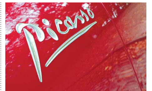
Geparkt: Citroën Picasso Seite 6

Die Illustration: Silke Bachmann; www.liaiborges.de; Aka/Adrienne/FTD-Montage; gftymage/FTD-Montage; Ullstein Bild/Granger Collection/Christian Richter/Anur/FTD-Montage; FTD/Ines Fischer