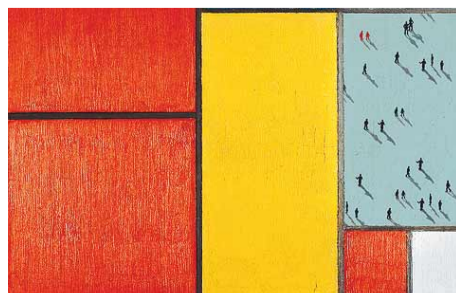
Geerdet: Alltagskunst Seite 3