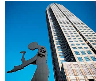
22 Meter hoch mit Hammer: Jonathan Borofskys Hammering Man