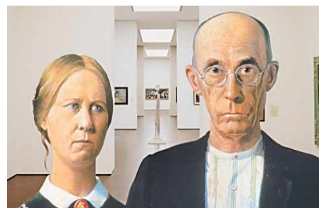
Gebucht: Art Escort Seite 5